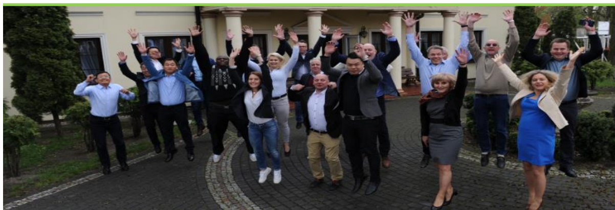
Bild från Oboya Horticulture internationella säljmöte "Grow with Oboya" april 2017

Genomsnitt av antalet anställda vid varje periods utgång.